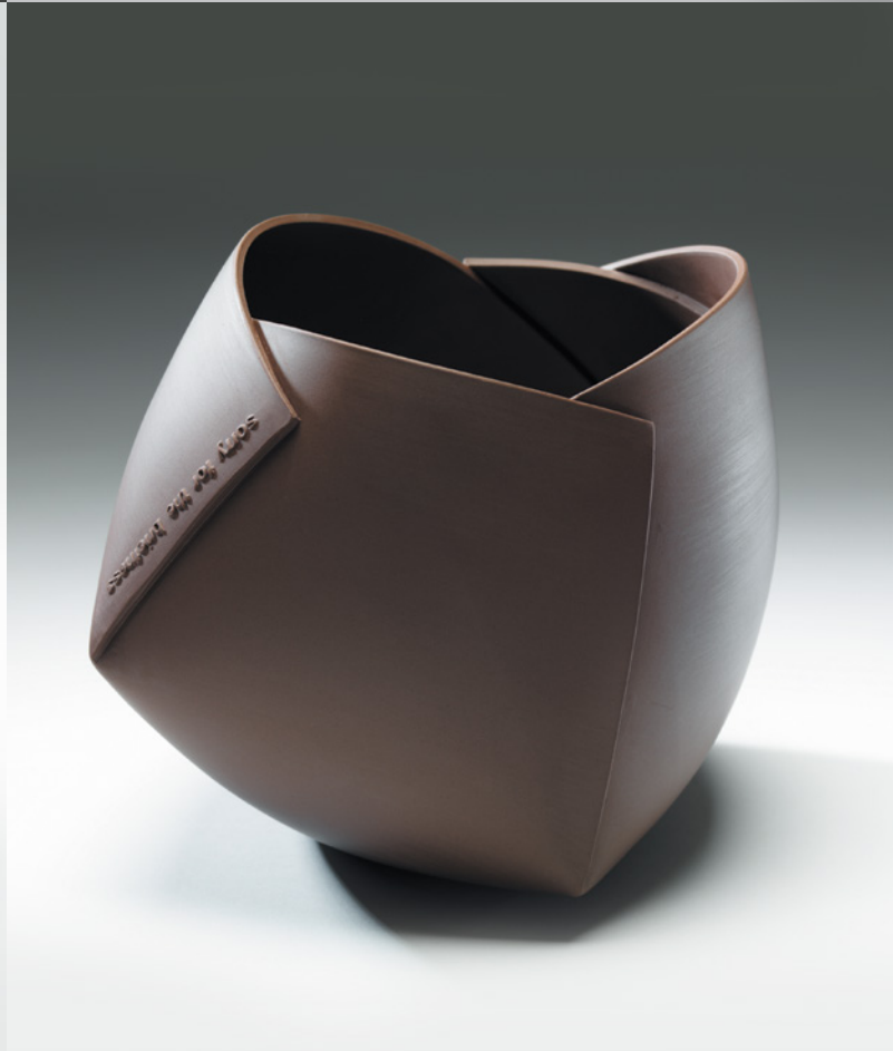
Ann Van Hoey, linksboven: Vessel , 2010; aardewerk, platenopbouw, mal; h. 17 x 22 x 33 cm | h. 15 x 30 x 30 cm. | rechtsboven: Vessels , 2012; aardewerk, platenopbouw, mal; h. 12 x 13 x 13 cm | h. 15 x 16 x 16 cm | h. 18 x 20 x 20 cm. | linksonder: Vessels , 2012; aardewerk, platenopbouw, mal; (oranje) h. 21 x 28 x 23 cm | (donker) h. 25 x 37 x 26 cm. | rechtsonder: Vessel Sorry for the briefness , 2013; aardewerk, platenopbouw, drukmal; h. 19 x 23 x 20 cm.