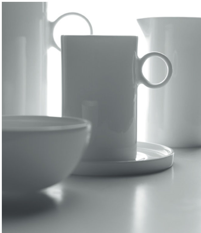
Ann Van Hoey, Servies Geometry , 2011; Fine Bone China porselein; kopjes h. 8,5 cm, Ø 5 cm | h. 7 cm, Ø 4,5 cm | melkkannetje h. 8,5 cm, Ø 4,5 cm. Producent Serax, Kontich, België.

Pas wanneer je zo'n pronkstuk in handen neemt, merk je dat het nauwelijks iets weegt. Perfectie alom.